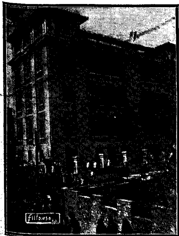
LA ENSEÑANZA EN MADRID.—El grupo escolar Amador de los Ríos, inaugurado ayer por el presidente de la República

creaban. De tal manera, que utilizando un símil muy generalizado en Rusia—el de la tijera abierta—, la tijera de la enseñanza primaria en España se iba abriendo más y más. Y conforme se abría, lejos de disminuir, el coeficiente de analfabetismo aumentaba cada año. Fué en la República, y en ningún momento antes que en la República, cuando se inició el movimiento de cerrar la tijera. Y se