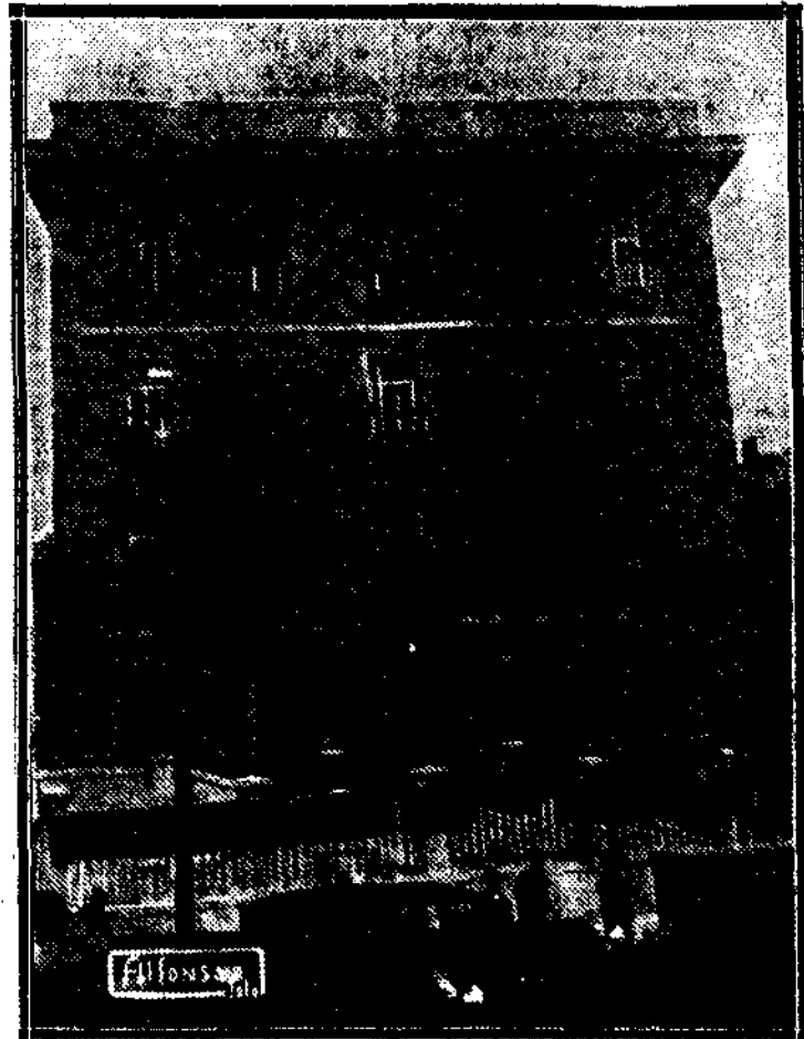
LA ENSEÑANZA EN MADRID.—El grupo escolar Tirso de Molina, inaugurado ayer por el presidente de la República

El presidente de la República visitó las clases de la Escuela Normal, las oficinas de la Inspección de Enseñanza, el Museo Pedagógico Nacional y la escuela primaria graduada, que servirá para que