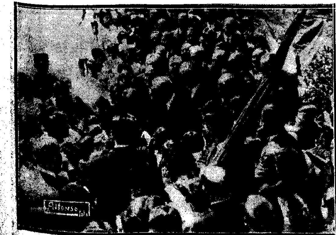
LA ENSEÑANZA EN MADRID.—S. E. el presidente de la República, con el alcalde de Madrid, el presidente del Congreso, el ministro de Instrucción pública y otras personalidades, inaugurando el grupo escolar Marcelo Usara

creaban. De tal manera, que utilizando un símil muy generalizado en Rusia—el de la tijera abierta—, la tijera de la enseñanza primaria en España se iba abriendo más y más. Y conforme se abría, lejos de disminuir, el coeficiente de analfabetismo aumentaba cada año. Fué en la República, y en ningún momento antes que en la República, cuando se inició el movimiento de cerrar la tijera. Y se