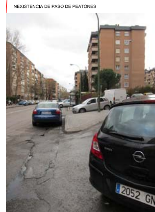
INEXISTENCIA DE PASO DE PEATONES