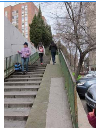
ESCALERA Y RAMPA NO ACCESIBLE PARA PERSONAS DE MOVILIDAD REDUCIDA