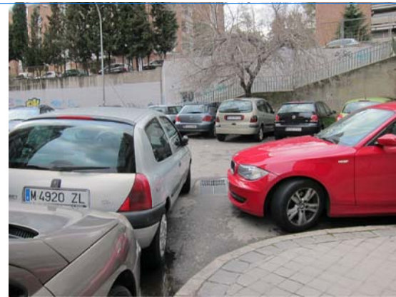
INEXISTENCIA DE PASO DE PEATONES