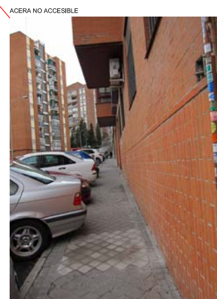
ACERA NO ACCESIBLE