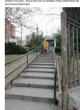
RAMPA ITALIANA - ESCALERA NO ACCESIBLE PARA PERSONAS DE MOVILIDAD REDUCIDA