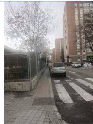
ACERA DE 1,00 m DE ANCHURA CON OBSTÁCULOS