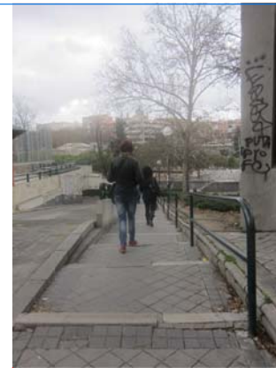
RAMPA ITALIANA - ESCALERA NO ACCESIBLE PARA PERSONAS DE MOVILIDAD REDUCIDA