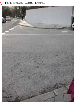
INEXISTENCIA DE PASO DE PEATONES