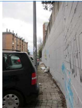
ACERA NO ACCESIBLE E IMPRACTICABLE